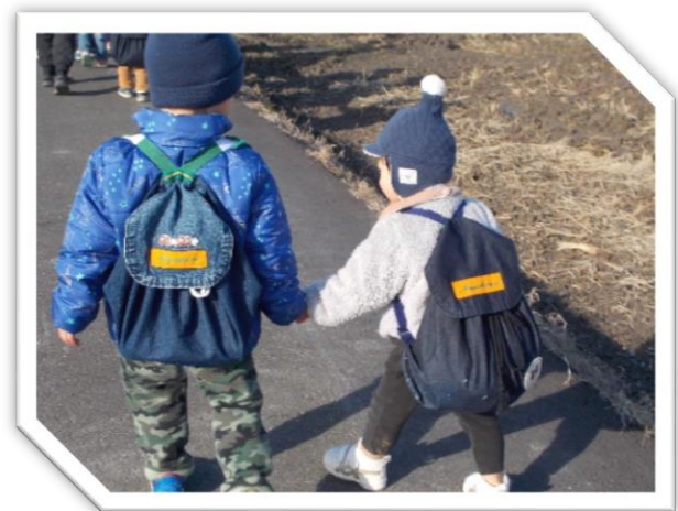
お兄さんと手をつないで毎日の散歩

インフルエンザや、新型肺炎など冬に流行する風邪も多くなっています。園でも換気や加湿などの環境の配慮を十分に行い、予防を心がけていきたいと思えます。