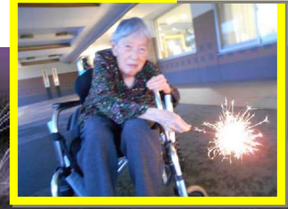
久しぶりの屋外で、合同の花火大会！「楽しい！」「キレイ！」「面白い(♡▽)」皆さん楽しい時間を過ごされました。