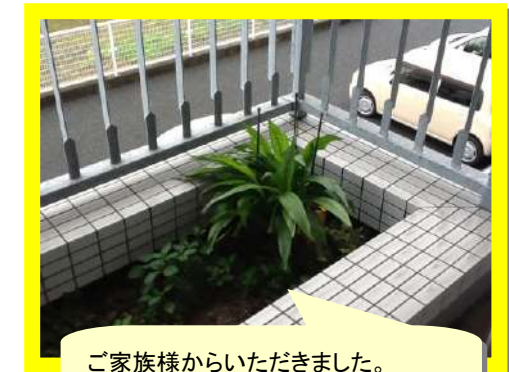
ご家族様からいただきました。しっかりお世話をしたいと思います。