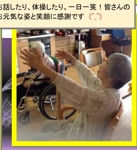
お話したり、体操したり。一日一笑！皆さんのお元気な姿と笑顔に感謝です (♡)