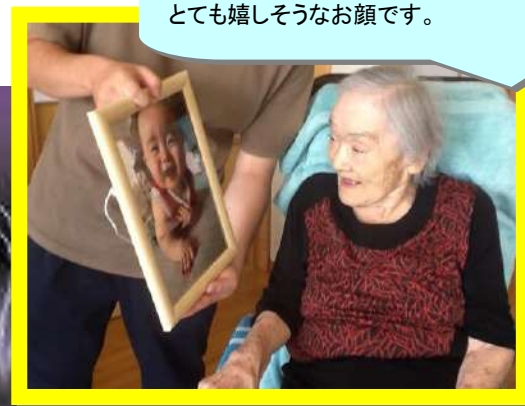
面会、外出で不自由をおかけしている中、ひ孫ちゃんの写真とお手紙が届きました。とても嬉しそうなお顔です。