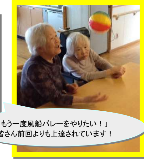
「もう一度風船バレーをやりたい！」皆さん前回よりも上達されています！