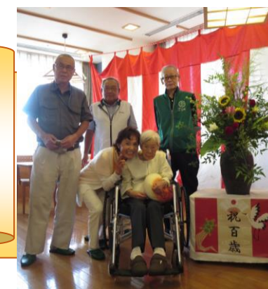
ご家族様と記念写真

今回23日間の実習を通して、2つの学びを深めていくことができました。1つ目は「利用者様とのコミュニケーション」です。第二・第三・ショート・デイに行き、積極的に会話をしてその方がどのような方なのかできるだけ理解するように心がけました。2つ目は「施設内での多職種との連携」です。各フロアのカンファレンスや会議・委員会等に参加し様子を見させていただきました。そして各職種がどのような役割を持って、どのように連携を図っているのかを深く学び知ることができました。私自身にとって、これらの実習は大変貴重なものとなりました。