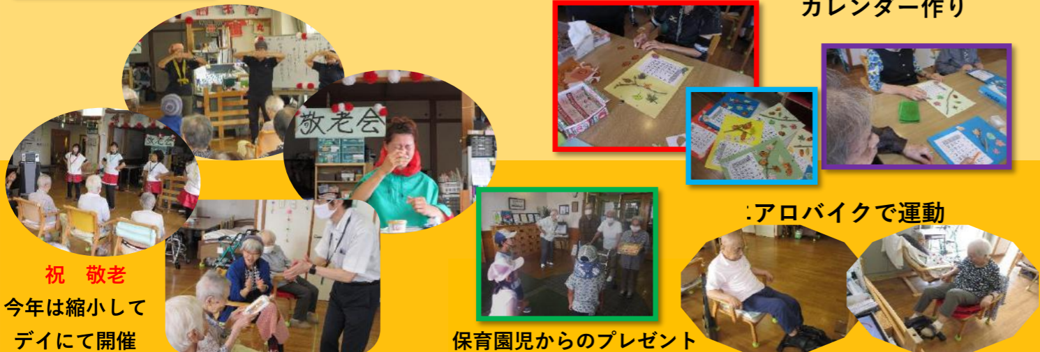
祝 敬老 今年は縮小して デイにて開催