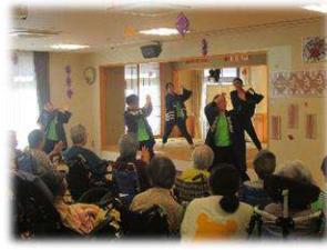
(新入職員による よさこいソーラン節)