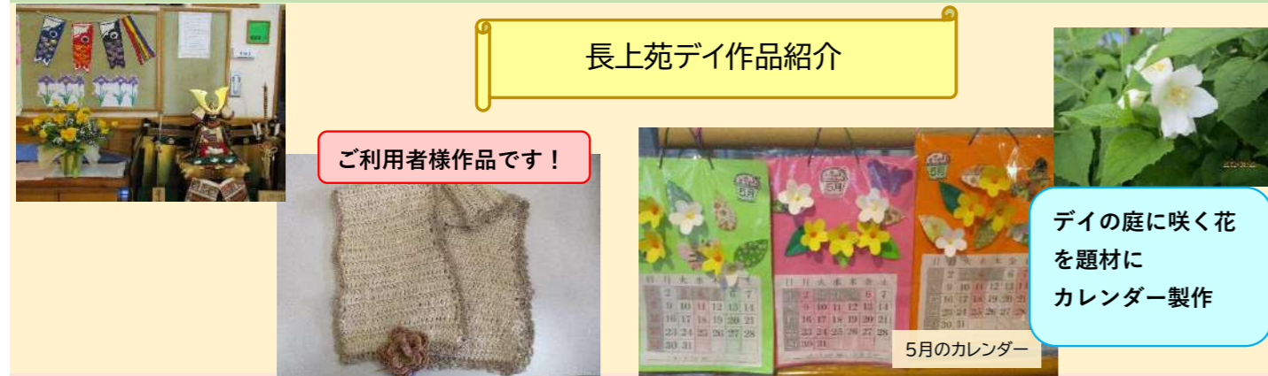
ご利用者様作品です！