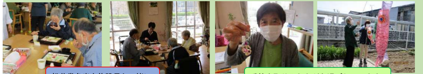
季節を取り入れながら過ごしています