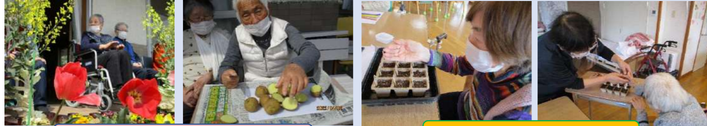
春の畑作り（じゃが芋・人参・大根等）

風も暖かく暑く感じる日も増えてきました。春から夏への移り変わりを楽しみながら日常を大切にしていきます。