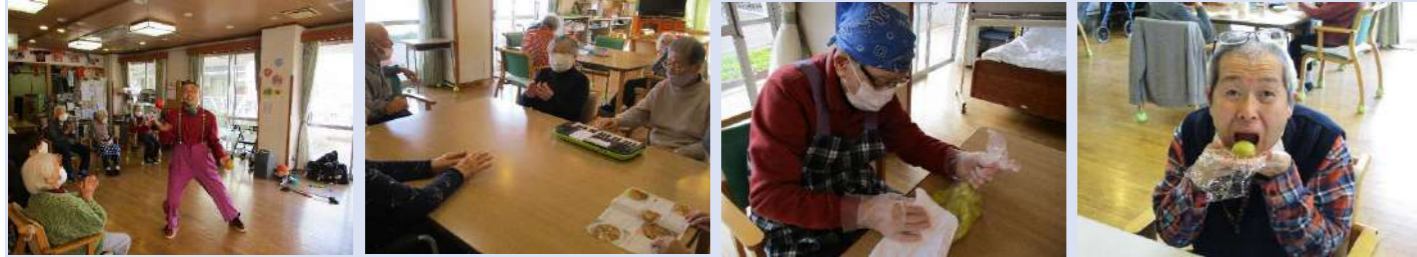
利用者様や職員と一緒に

冬の足音が段々と近づいてきました。厚着になりやすいですがデイの室内は暖房で暖かくしています。重ね着をしなくても安心してご利用いただけます。