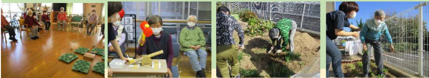
天気の良い日は外に出て