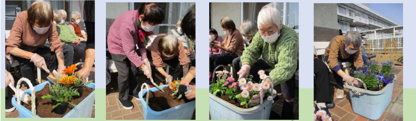
春の花をみんなで植えつけ

この4月より地域密着型通所介護から通常型通所介護と変更になり、定員も7名増加の25名となります。職員も増え大所帯となりますが、今まで通り皆さんの楽しみが続くように取り組んでいきたいと思っておりますのでこれからも宜しくお願い致します。 職員一同