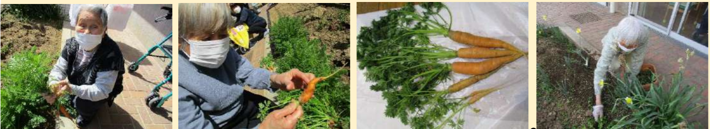
人参の収穫や畑の草取りを行いました

【空き情報】 4月から定員が25名となります。いつでもご利用受け付けております。 3月25日現在