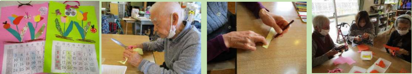
皆でチョキチョキしてカレンダー作り