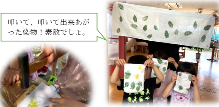
叩いて、叩いて出来あがった染物！素敵でしょ。

ながかみこども園は“生活を中心”に、遊びを通して学びを深めています。この時期にはどんな遊びができ、この時期にはどんな物が収穫できる。これは、ながかみの生活の経験の積み重ねです。やまももや梅をブルーシートを叩いて収穫するなんて、知っている子はなかなかいませんね。遊びながら学び、知っている、楽しいやできるという気持ちを大切に「夏の遊び」も全力で楽しんでいきたいと思っています。