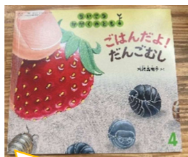
月間絵本 ちいさながかくのとも4月号 今月は『ごはんだよ！だんごむし！』