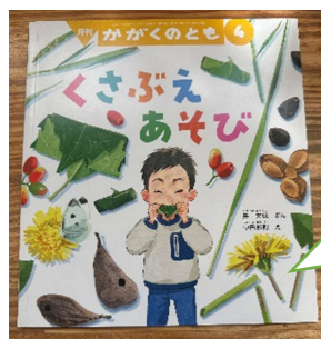
月間絵本 かがくのとも4月号 今月は『くさぶえあそび』 田んぼや道端、川原へ行き、音のなる草で音を楽しむ。昔の知恵の伝承と草花の種類への興味と音を出すために親子が挑戦していく姿が魅力的な本です。