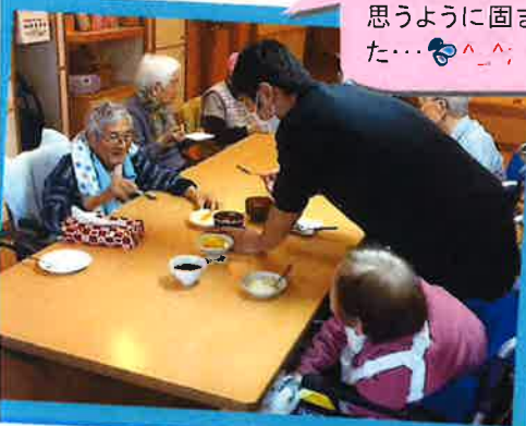
杏仁豆腐を作りました。でも 思うように固まらず、焦りまし た…(^_^;)