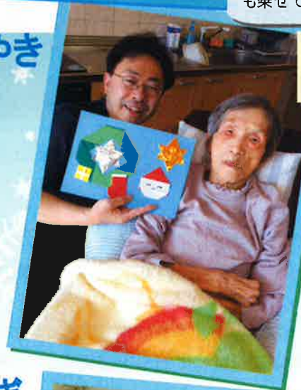
折り紙を使って、皆さんでクリスマス飾りを作りました。お好きな ようにデザインしていただき、皆さん満足した笑顔でパチリ☆