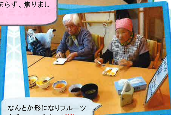
なんとか形になりフルーツ も乗せて、成功!! (^^)!!