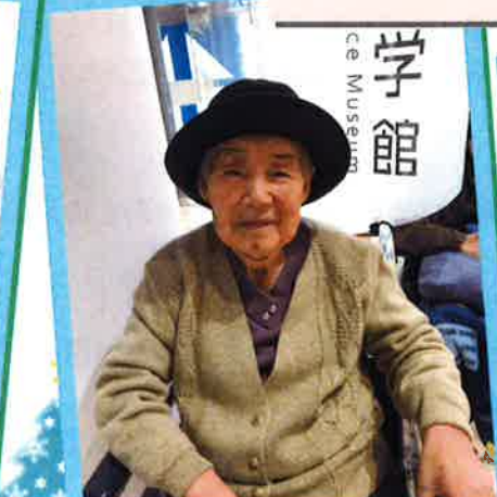
浜松科学館へ行ってきました。「こんなとこ、初めて来た！」 といろいろ興味深く見学されていました。(・ω・)