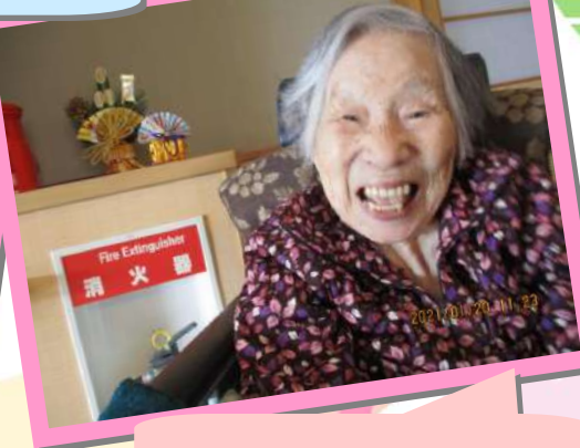
「ミニ門松」の前で、はいチーズ☆