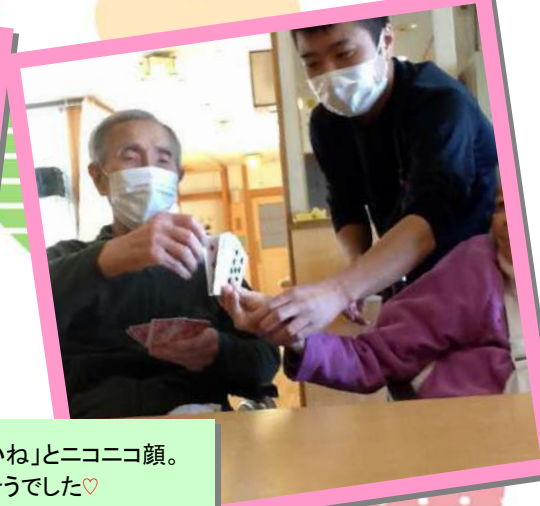
久しぶりのトランプで皆さん大盛り上がり!「たまには良いね」とニコニコ顔。そのうち皆さんだんだん真剣になってきて...とても楽しそうでした♡