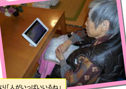
最先端の「リモート参拝」を体験していただきました。ライブ動画をご覧になり「人がいっぱいいるね」と驚かれた様子。「ところで、熱田神宮ってどこだっけ?」