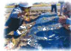
地域の方々と交流(玉ねぎ植え)