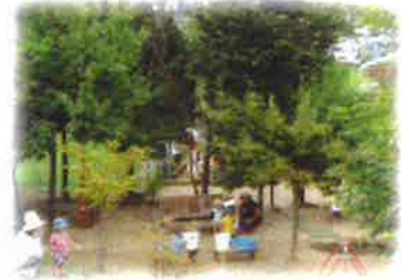
ながかみこども園園庭